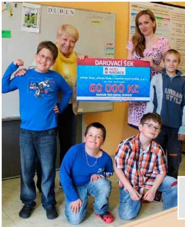
Střední škola, základní škola a mateřská škola JISTOTA, o. p. s.