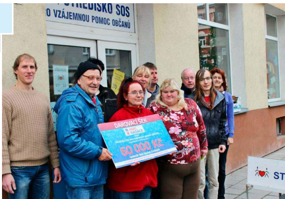
Středisko SOS pro vzájemnou pomoc občanů