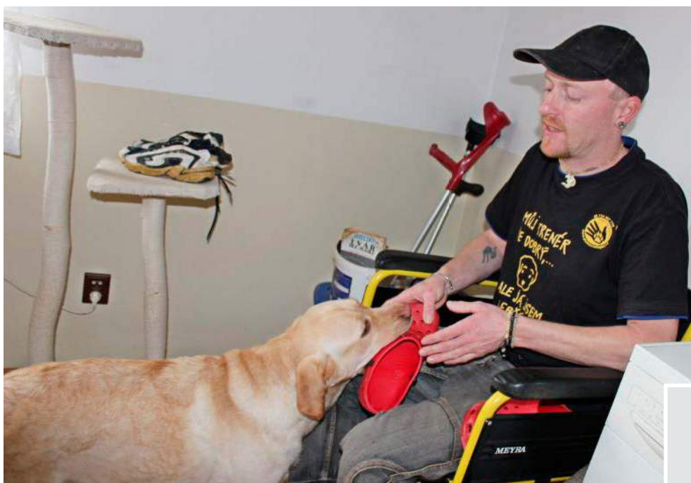
Pomocné tlapky o. p. s.