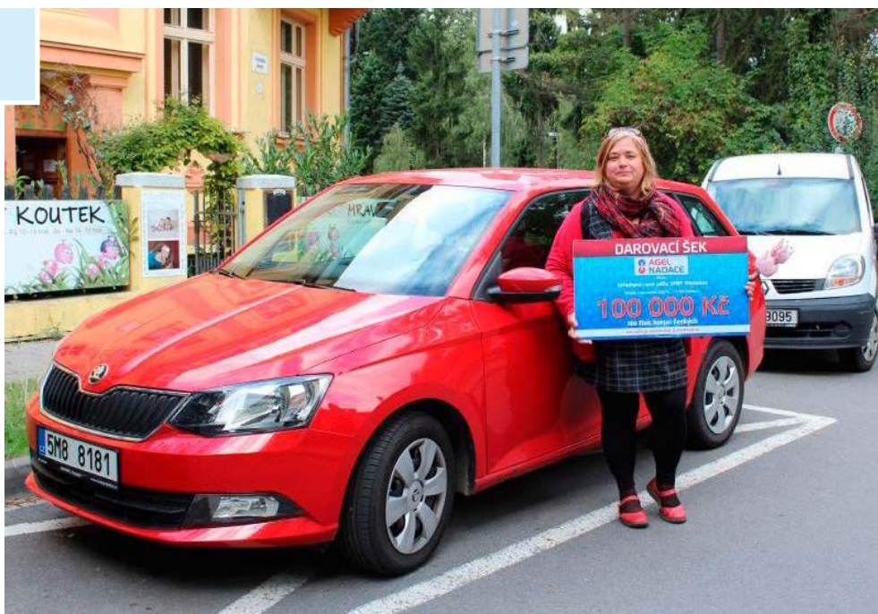
Středisko rané péče SPRP Olomouc