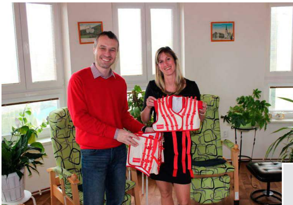
PONTIS Šumperk o. p. s.