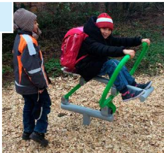
Dětský domov a Školní jídelna Prostějov