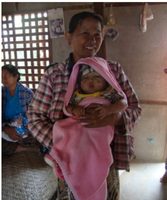
MAGNA, Děti v tísní

1. Prvním podpořeným projektem bylo poskytnutí nadačního příspěvku ve výši 500 000 Kč obecně prospěšné společnosti MAGNA, Děti v tísní. Tyto finanční prostředky byly využity na realizaci projektu „Posílení nutriční péče – ženy, děti Barma“. Cílem projektu, na kterém se podílí také NADACE AGEL, je zajistit systém nutriční pomoci pro děti do pěti let, zajistit jim dodávky terapeutické stravy k léčbě akutní podvýživy a nutriční stravy. V rámci projektu byly léčeny děti s těžkou akutní podvýživou a byla zajištěna distribuce vitamínu A a zinku pro všechny děti do pěti let věku v této oblasti.