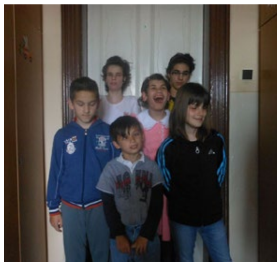
Škola internátna v Levoči

1. NADACE AGEL podporuje nejen organizace v České republice, ale i v zahraničí – konkrétně na Slovensku. Zde částkou 1 100 EUR podpořila Spojenou školu internátnu. Ta díky těmto prostředkům mohla zafinancovat stravné pro žáky ze sociálně znevýhodněných rodin, konkrétně šest dětí se zrakovým postižením.