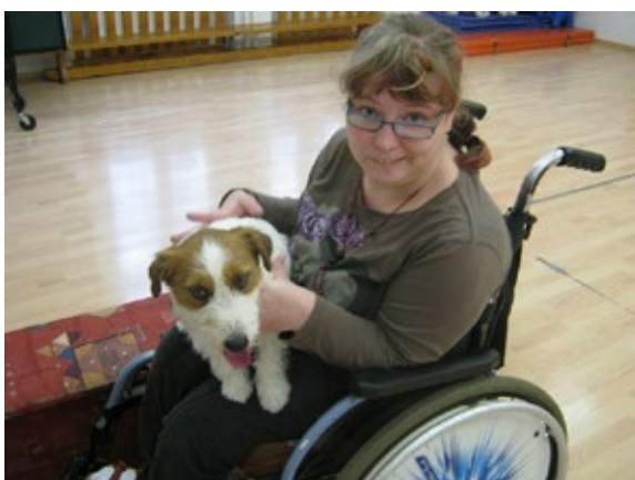
Střední škola, základní škola a mateřská škola JISTOTA o. p. s.

4. Dalším obdarovaným byla Střední škola, základní škola a mateřská škola JISTOTA, o. p. s., u níž NADACE AGEL podpořila dvě žádosti v celkové částce 70 000 Kč. Část směřovala na financování hiporehabilitace, canisterapie a terapie v solné jeskyni. Tyto činnosti zlepšují zdravotní stav těžce postižených dětí, zpevňují svalový tonus a celkově utužují organismus dítěte. Další částka byla věnována na vybavení multifunkční dílny, kde děti mohou rozvíjet svou kreativitu a dále se vzdělávat. NADACE AGEL podporuje SŠ, ZŠ a MŠ JISTOTA, o. p. s. již třetím rokem.