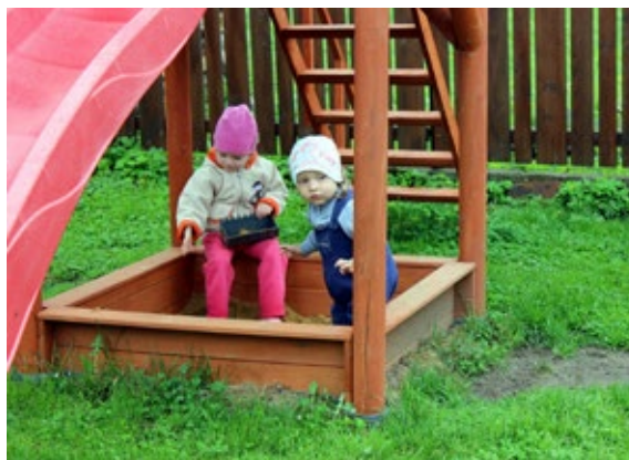
Charita Nový Jičín – azylový dům

3. NADACE AGEL podpořila částkou 50 000 Kč Charitu Nový Jičín k zakoupení a instalaci vybavení zahrady azylového domu. Volnočasové aktivity na zahradě a její celkové využití napomůže k rozvíjení vztahu mezi matkou a dítětem a zároveň poskytne nové aktivity pro klienty, jako jsou například terapeutická sezení, arteterapie, společné aktivity, doučování.