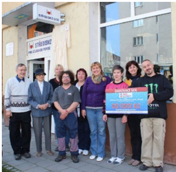
Středisko SOS Olomouc

běstačnost hendikepovaných pracovníků a zvýšily kvalitu jejich života.