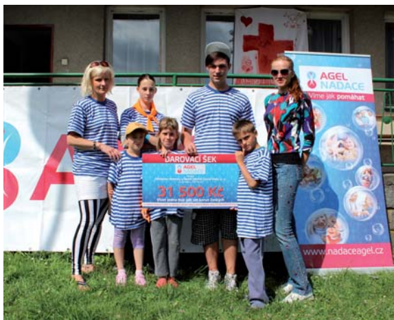
Předání darovacího šeku dětem z Dětského domova Černá Voda na letním táboře v Rapotíně

3. Díky příspěvku NADACE AGEL mohlo pět dětí z Dětského domova Černá Voda během července strávit příjemné dva týdny na dětském táboře pro děti zaměstnanců skupiny AGEL v krásném prostředí rekreačního střediska Losinka v Rapotíně u Velkých Losin na Šumpersku. NADACE AGEL na jejich pobyt poskytla příspěvek v celkové výši 31 500,- Kč. Pro děti zde byl připraven bohatý program plný her, soutěží, zábavy a legrace v duchu města Kocourkova.