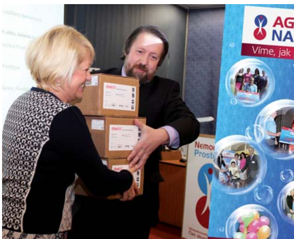
Předání oxymetrů primáři dětského oddělení Nemocnice Prostějov

6. Posledním podpořeným případem v této kategorii bylo poskytnutí příspěvku Základní škole a Mateřské škole pro sluchově postižené v Ostravě-Porubě. NADACE AGEL v tomto případě přispěla částkou ve výši 46 000,- Kč na zakoupení speciálního zařízení využívaného při komunikaci se žáky prostřednictvím bezdrátové naslouchací aparatury.