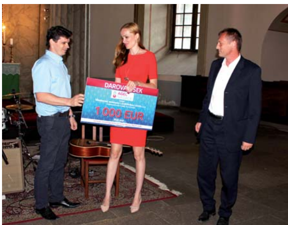
Předání darovacího šeku zástupcům Všeobecné nemocnice s poliklinikou Levoča

2. V rámci České republiky přispěla NADACE AGEL částkou ve výši 100 000,- Kč Vítkovické nemocnici na podporu rozvoje dětského oddělení, kde se již více než sedm let zabývají problematikou terapie dětské alimentární obezity. V souvislosti s tím byla část příspěvku NADACE AGEL využita na nákup speciální lékařské váhy TANITA BC-418 MA, která se stala výborným pomocníkem při boji s dětskou obezitou.