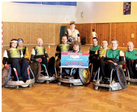
Předání symbolického šeku členům SK BESKYD HANDICAP

4. NADACE AGEL se dále rozhodla podpořit sportovní aktivity tělesně postižených a věnovala částku 50 000,- Kč sportovnímu klubu vozíčkářů SK BESKYD HANDICAP. Tento sportovní klub pořádá každoročně jedno kolo první ligy ragby vozíčkářů, které se letos konalo 7. a 8. září v Ostravě právě díky využití prostředků věnovaných nadací.