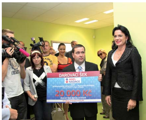
Předání darovacího šeku léčebně dlouhodobě nemocných Nemocnice Prostějov

3. Částkou ve výši 20 000,- Kč přispěla NADACE AGEL léčebně dlouhodobě nemocných Nemocnice Prostějov na zakoupení přístroje Eca Fog 80. Tento speciální přístroj slouží k pročišťování vzduchu a výrazně tak přispívá ke zkulturnění prostředí a zvýšení komfortu pacientů.